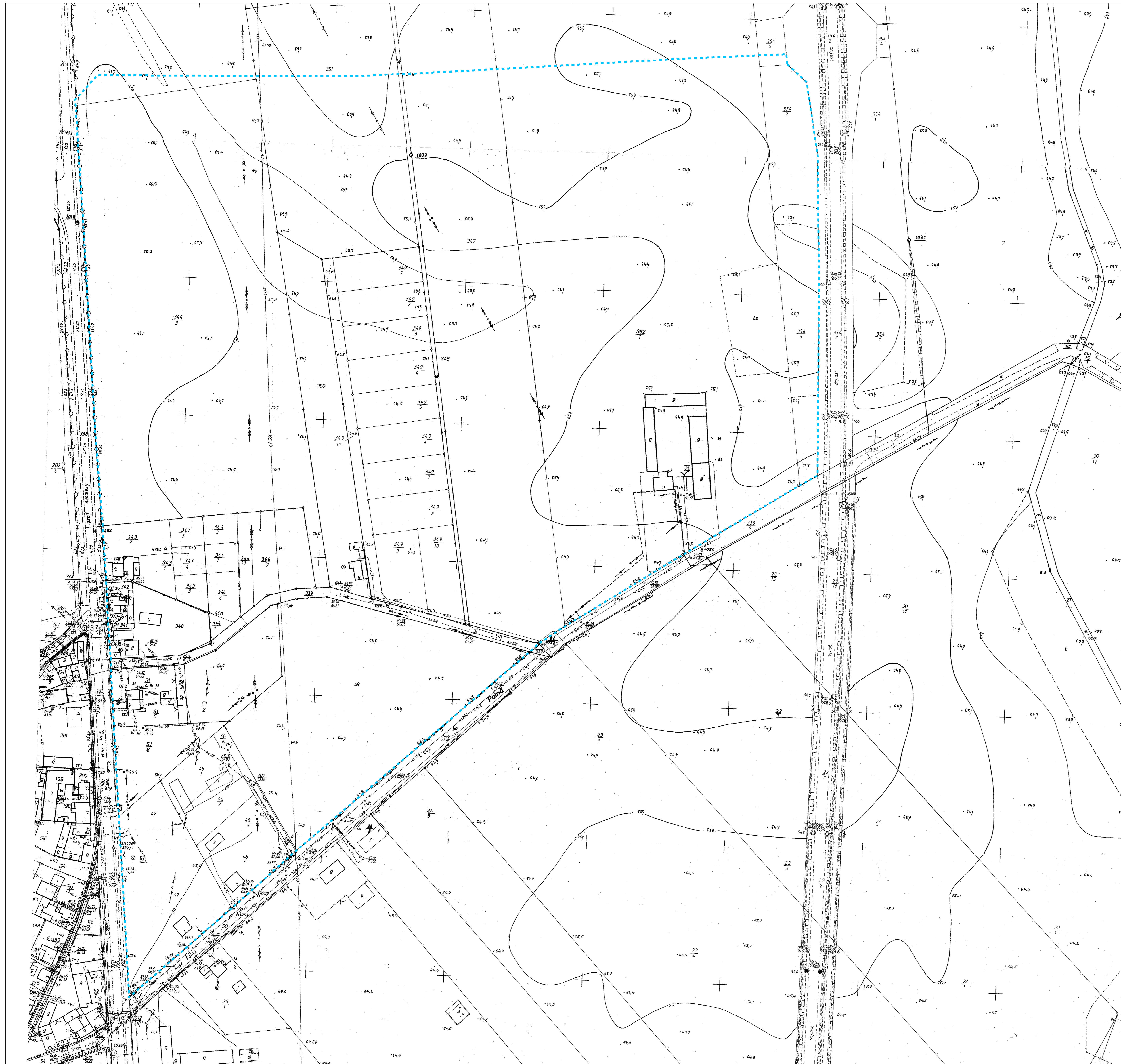
Wrys ze Studium Uwarunkowań i Kierunków Zagospodarowania Przestrzennego Gminy Śrem skala 1:10 000