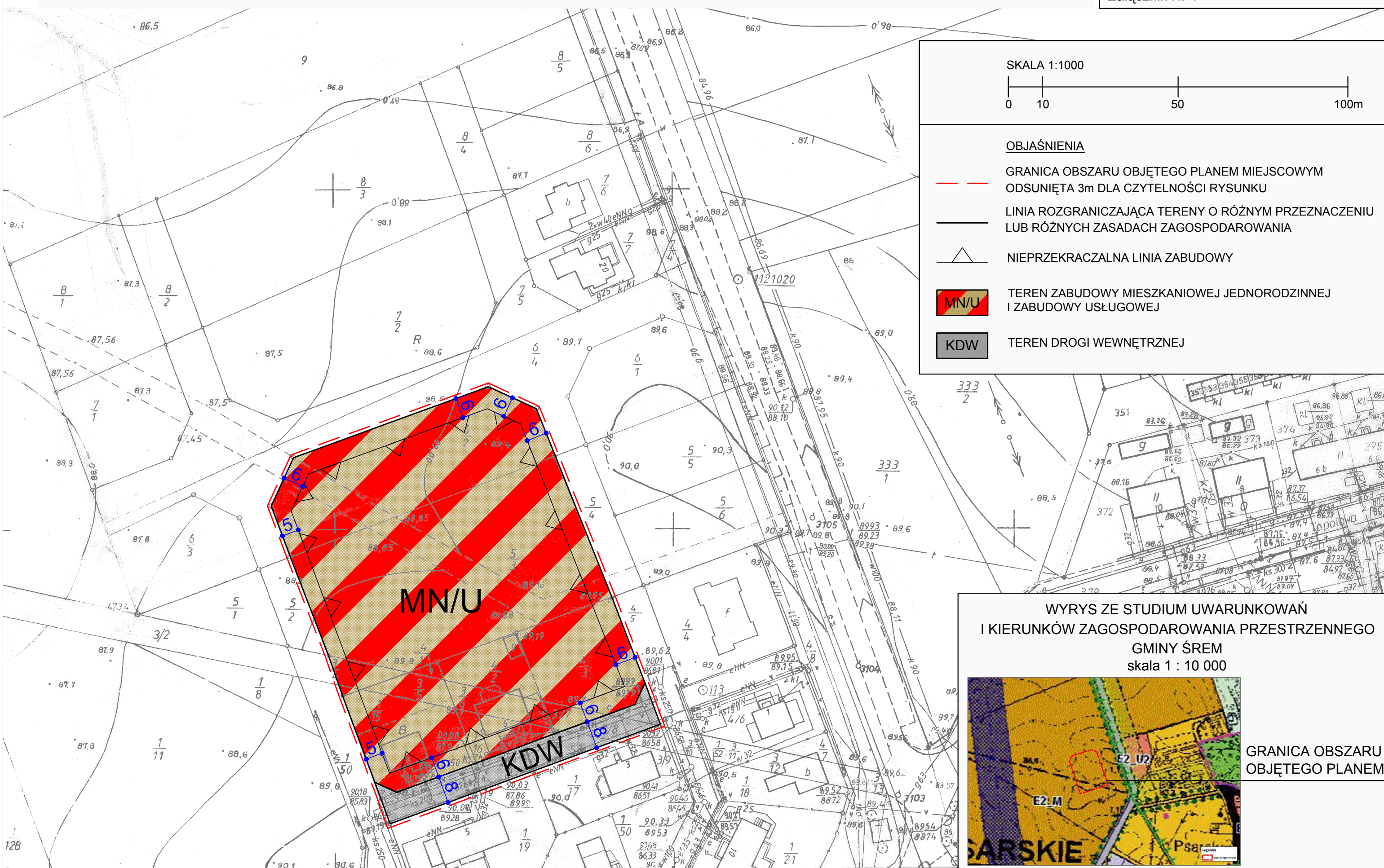
WYRYS ZE STUDYUM UWARUNKOWAŃ I KIERUNKÓW ZAGOSPODAROWANIA PRZESTRZENNEGO GMINY ŚREM skala 1 : 10 000