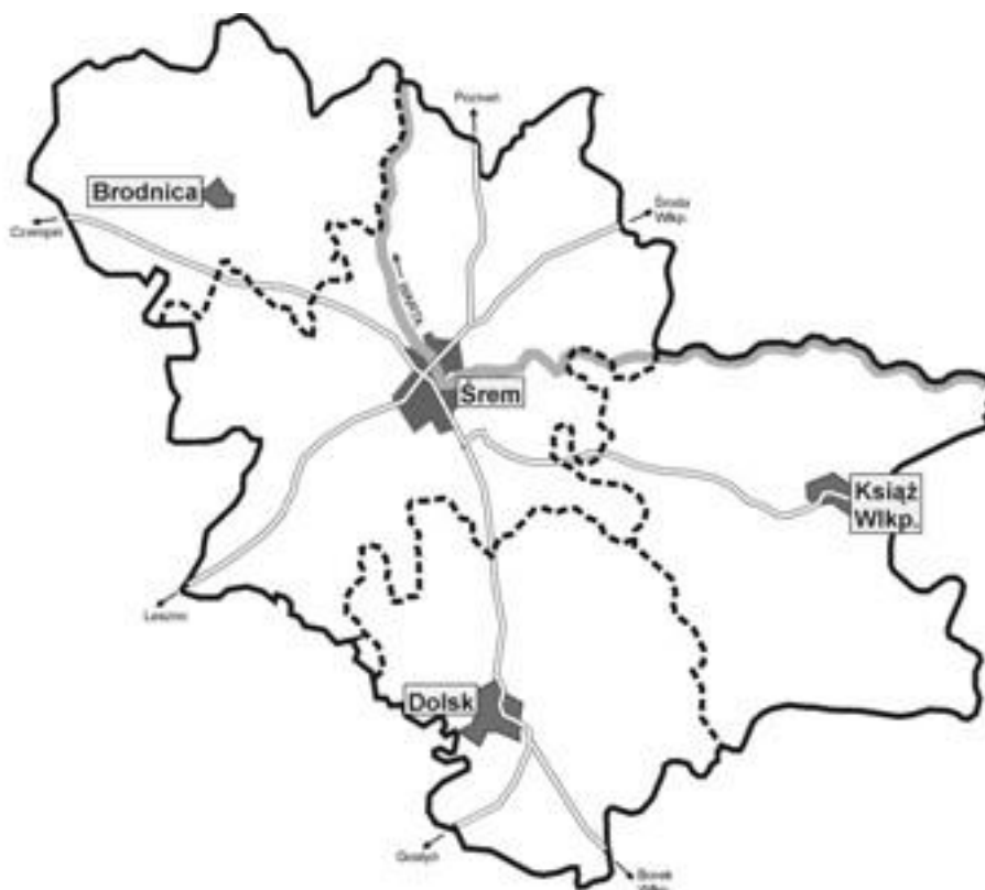
Mapa 1. Powiat Śremski