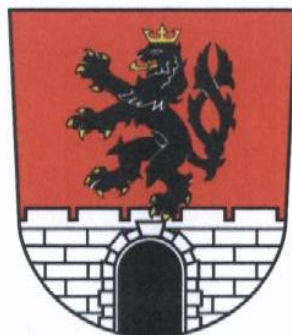
ROZNOV POD RADHOSTEM

ROZNOV POD RADHOSTEM/ CZECHY ŚREM/ POLSKA BERGEN/ NIEMCY