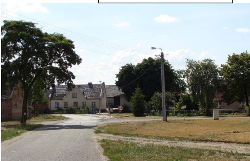
Zabytkowy dom z 1913r.

Wiadomo, że w Nochówku na początku dwudziestego wieku znajdował się stary młyn – prawdopodobnie należący do majątku „Nochowo”. Dawniej część Nochówka, gdzie znajdują się szczątki starego młyna nazywano: Skrobaczem.