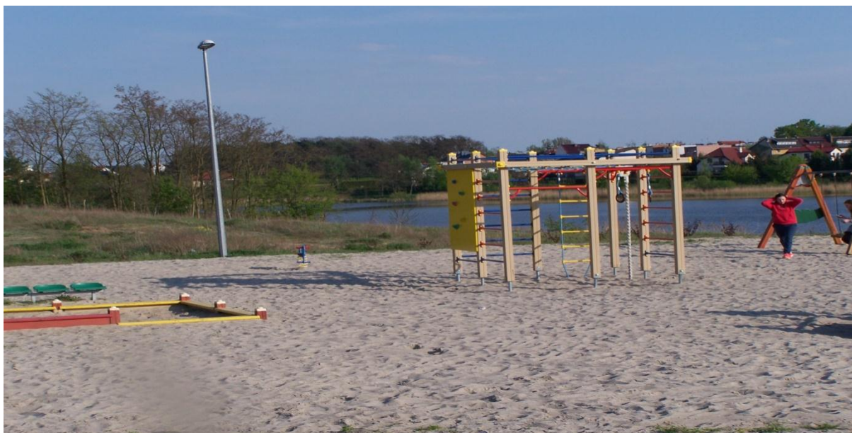
Rysunek nr 7. Plac zabaw.

Przez tereny wsi Psarskie przebiegają szlaki piesze i rowerowe, które są jednak do naprawy. Planowane jest wytyczenie nowych, które będą przebiegać z dala od głównych połączeń komunikacyjnych.