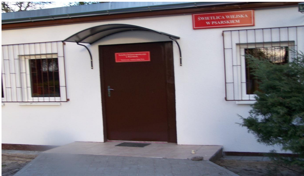
Rysunek nr 2. Świetlica wiejska

Na terenie sołectwa znajduje się świetlica wiejska, w której odbywają się również zajęcia socjoterapeutyczne. Kolejne instytucje to Filia Przedszkola „Słoneczna Szóstka” i Klubik Dziecięcy „Chatka Puchatka”. Bliskość położenia Śreму daje możliwość, że dzieci i młodzież korzysta ze szkół miejskich.