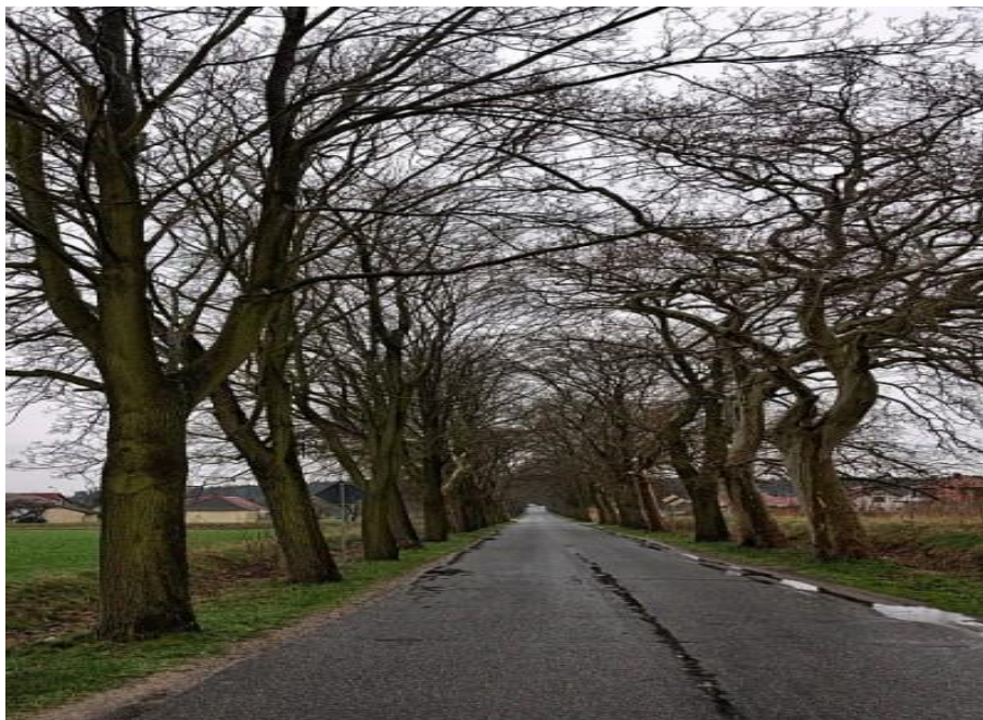
Rysunek nr 3. Aleja Platanowa.

Na terenie wsi Psarskie znajduje się kilka zabytków stanowiących integralną część dziedzictwa historycznego i narodowego. Do najważniejszych należą cmentarzysko kultury łużyckiej ( 700-400 lat p.n.e.), park krajobrazowy wraz z zabudową (koniec XVIII w.), zespół pałacowo – folwarczny(XIX w.), Figura Matki Boskiej i figura Serca Jezusa oraz aleja Platanowa ( XIX w.).