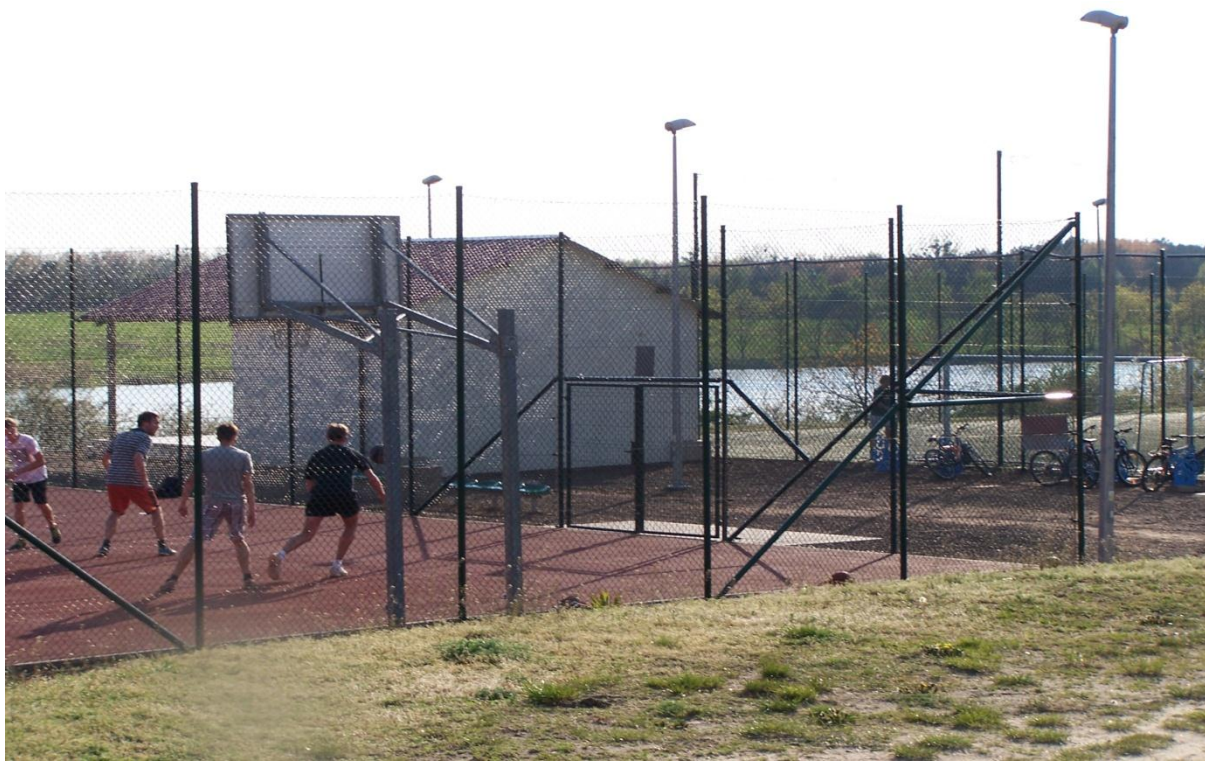
Rysunek nr 5. Teren sportowo rekreacyjny.

Na obszarze sołectwa znajduje się również teren sportowo – rekreacyjny (boisko do piłki nożnej i boisko do piłki siatkowej), plac zabaw z licznymi urządzeniami dla dzieci.