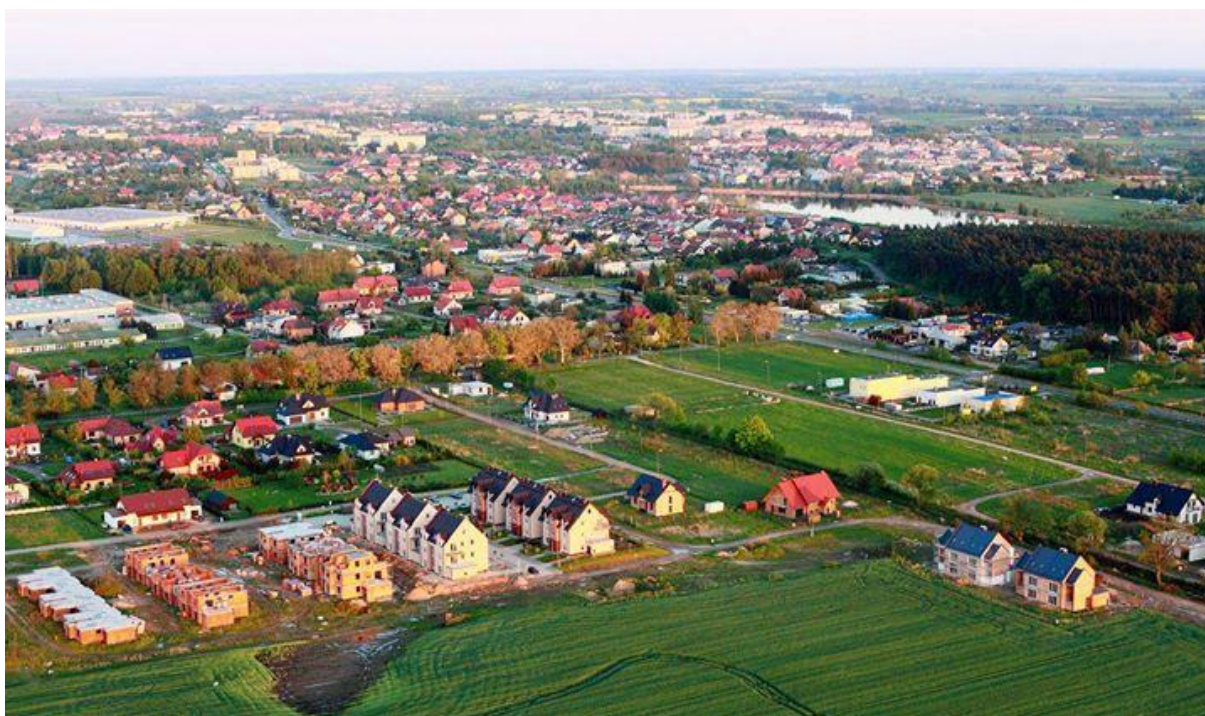
Rysunek nr 4. Psarskie –widok z góry.

- łągi topolowe i topolowo – wierzbowe z licznymi wiekowymi dębami,