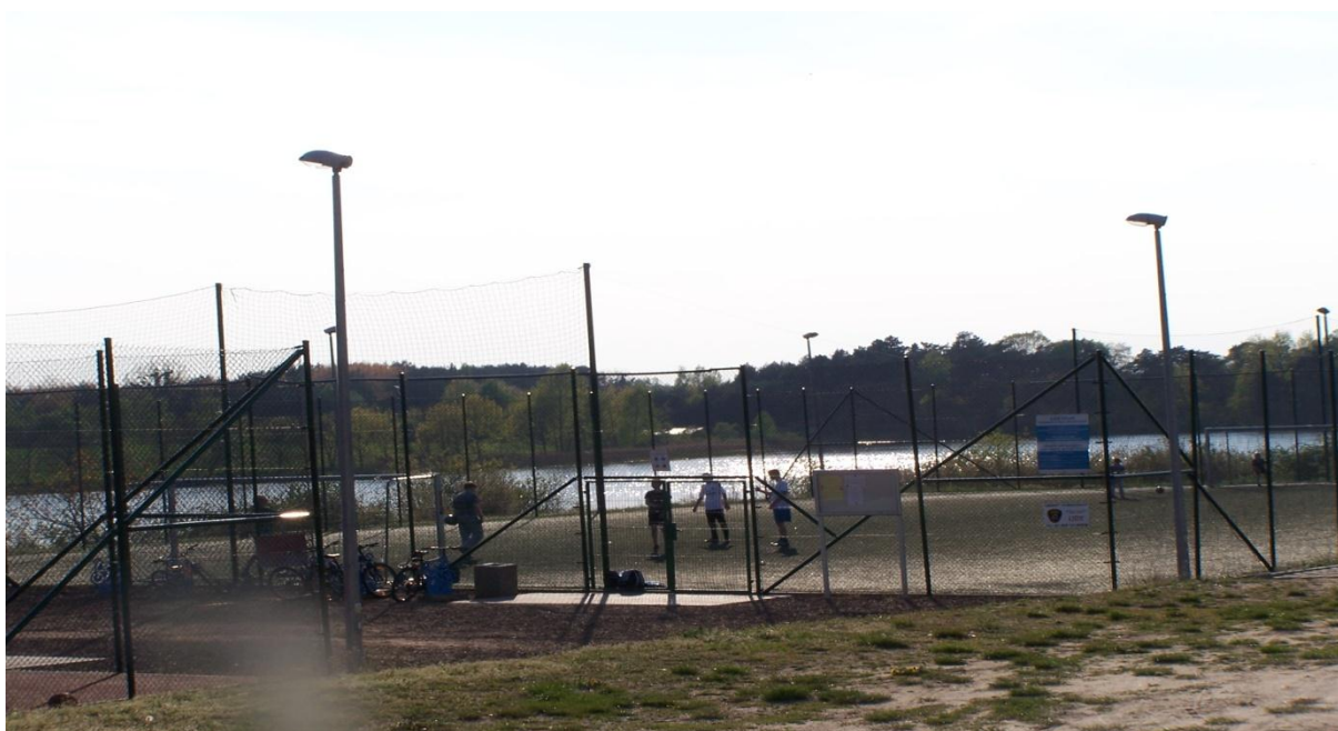
Rysunek nr 6. Teren sportowo rekreacyjny.