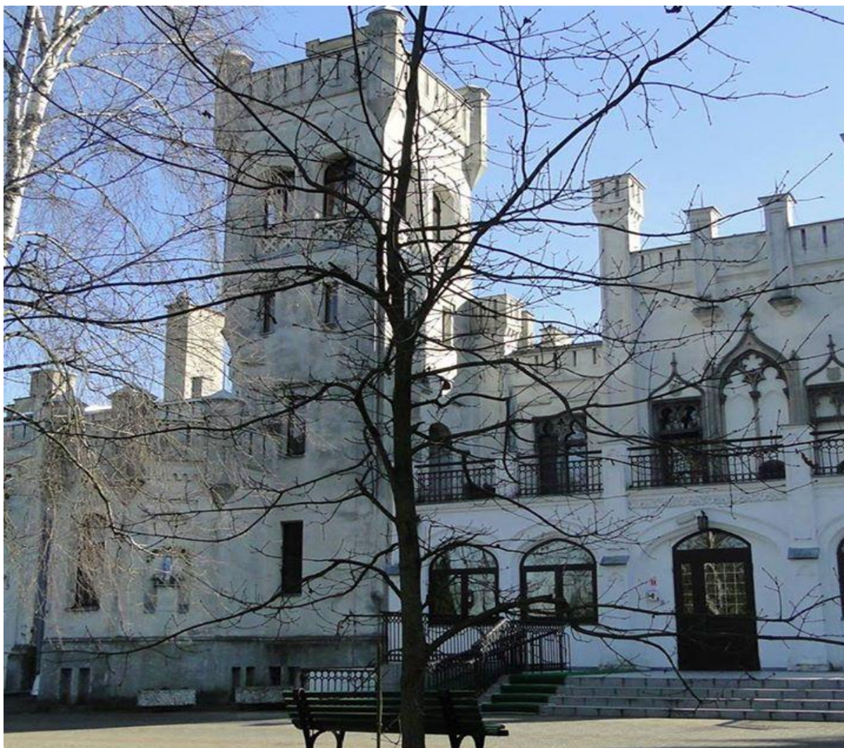
Rysunek nr 1. Zespół Pałacowy XIX w.