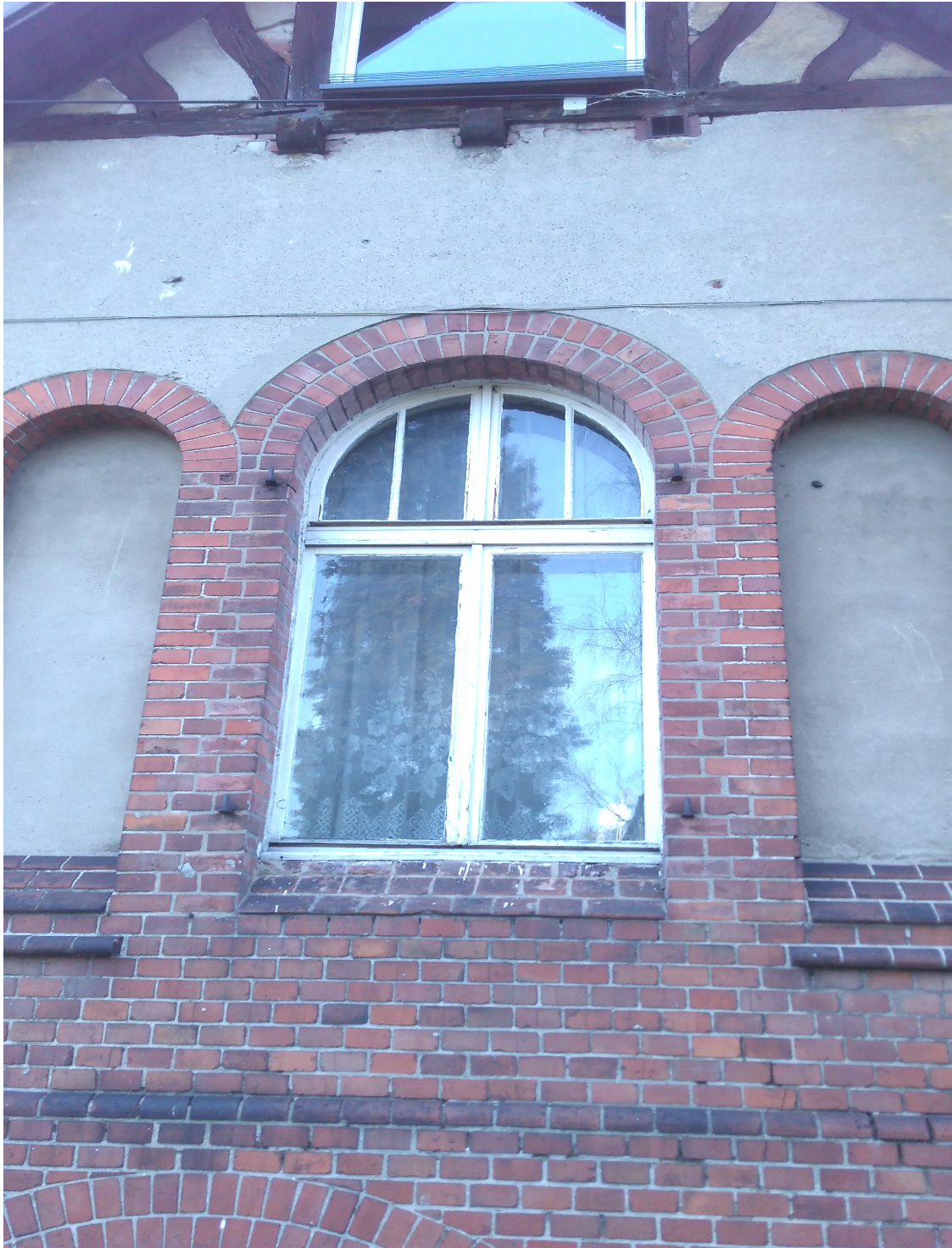
Stolarka okienna ( rys. nr 4 )