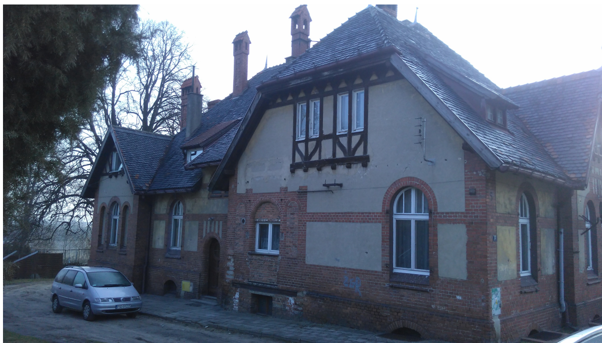
Elewacja boczna ( rys. nr 1)