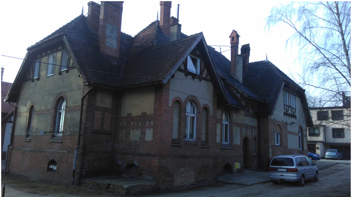
Elewacja frontowa ( rys. nr 2 )