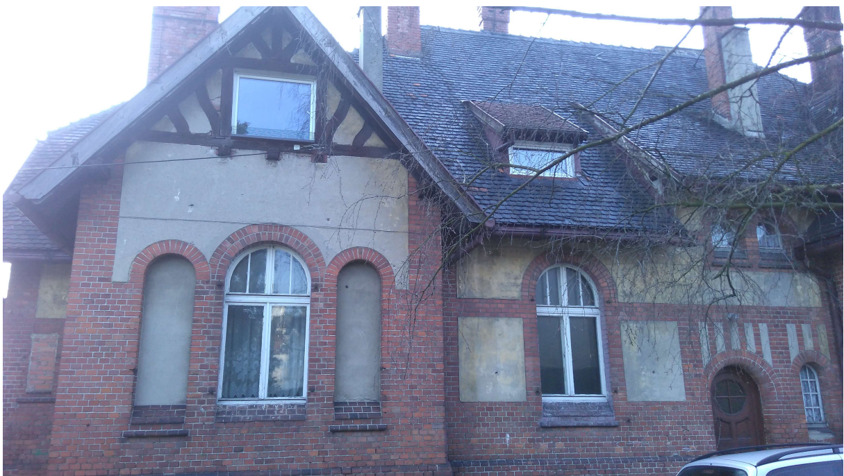
Elewacja boczna ( rys. nr 3 )