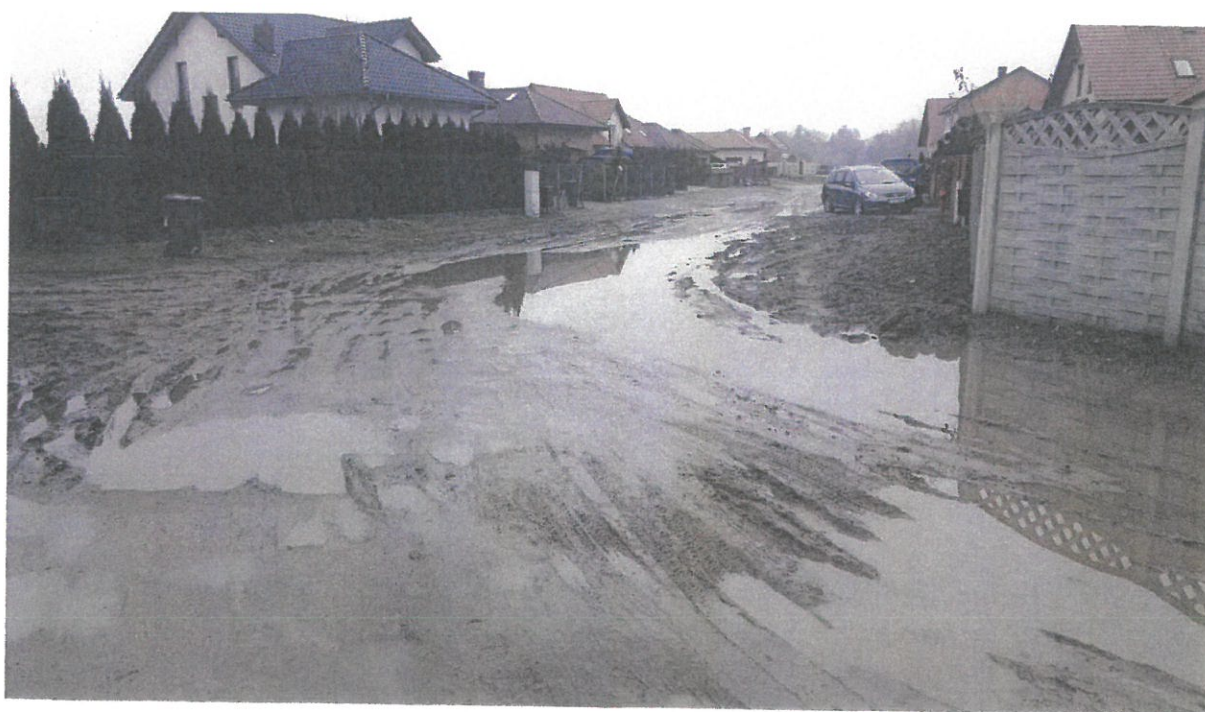
Rozwidenie ulic Bema i Baraniaka.